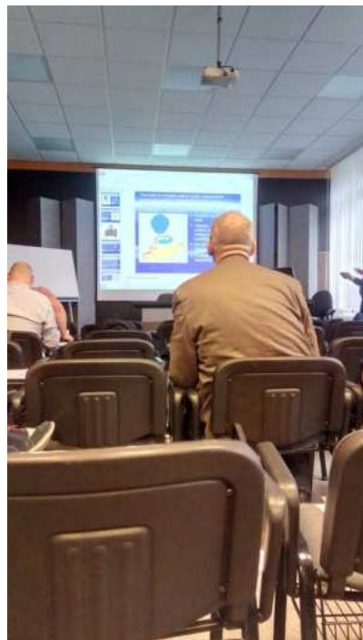
Foto zo školenia montáže vodomeroov a pracovného výjazdu v Slovenskom metrologickom ústave