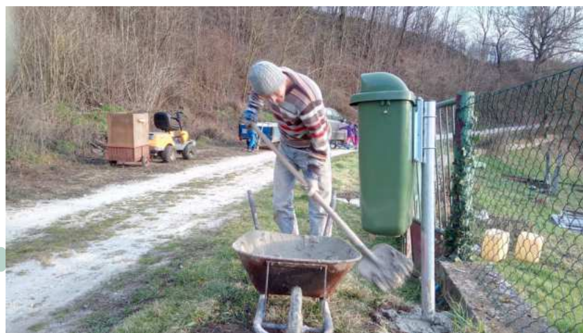
Inštalácia smetných košov na Modrovke /5 kusov/

Výborná akcia pod taktovkou organizácie Jednoty dôchodcov - občerstvenie, zábava, rozhovory, tanec, spev - výborne. Ďakujeme Jednote dôchodcov za svoje aktivity aj pre našich seniorov.